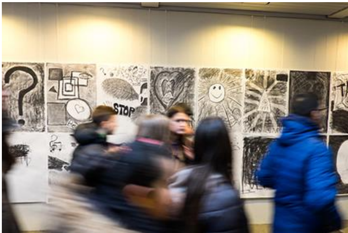
Fra åbningen af udstillingen "Unge i en forstad i Europa" hvor ca 300 unge fra 7. og 8. Klasse døviste deres bud på hvad det vil sige - støttet af Huskunstner ordningen.